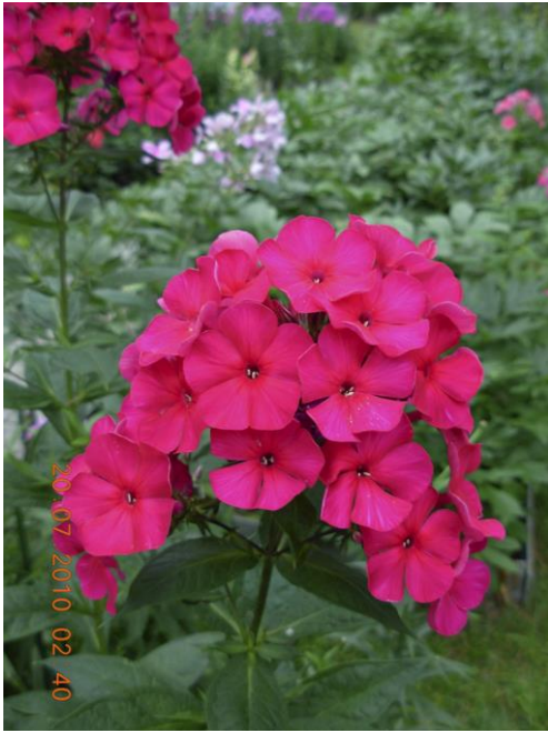
'Пламя' (Попов А.П.)