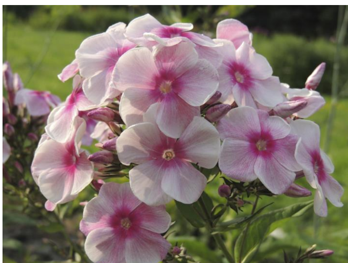
‘Розовый Иней’ (Репрѐв Ю.А.)

В течение нескольких лет, наблюдая за тем, как в его руках рождались шедевры, я почувствовал страстное желание самому попробовать вывести новые сорта. Я отнесся к этому как к научному эксперименту. К тому времени в моей коллекции было уже около 150 сортов флоксов. Мой первый селекционный опыт 1967 г. оказался неудачным. Из 100 семян, собранных с растений 30 сортов, не взошло ни одно. Это объяснялось тем, что тайнами селекции пришлось овладевать самостоятельно, опираясь лишь на те советы, которые иногда давал мне П.Г. Гаганов. Следующей осенью посев оказался более удачным, но шедевров из сеянцев все-таки не получилось. Немного порадовали лишь 'Галчонок', 'Куинджи' и 'Розовый Иней', которые я впервые представил в 1970 г. на ВДНХ.