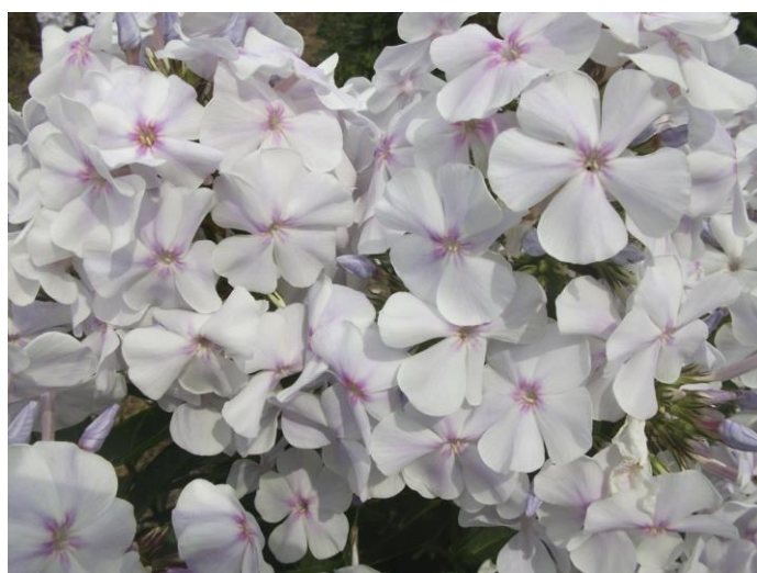
‘Небеса’ (Репрѐв Ю.А.)

В 1969 г. моим первым успехом стал новый сорт 'Небеса', хотя полностью, свои достоинства культивар продемонстрировал позже, красуясь на главной аллее ГБС и