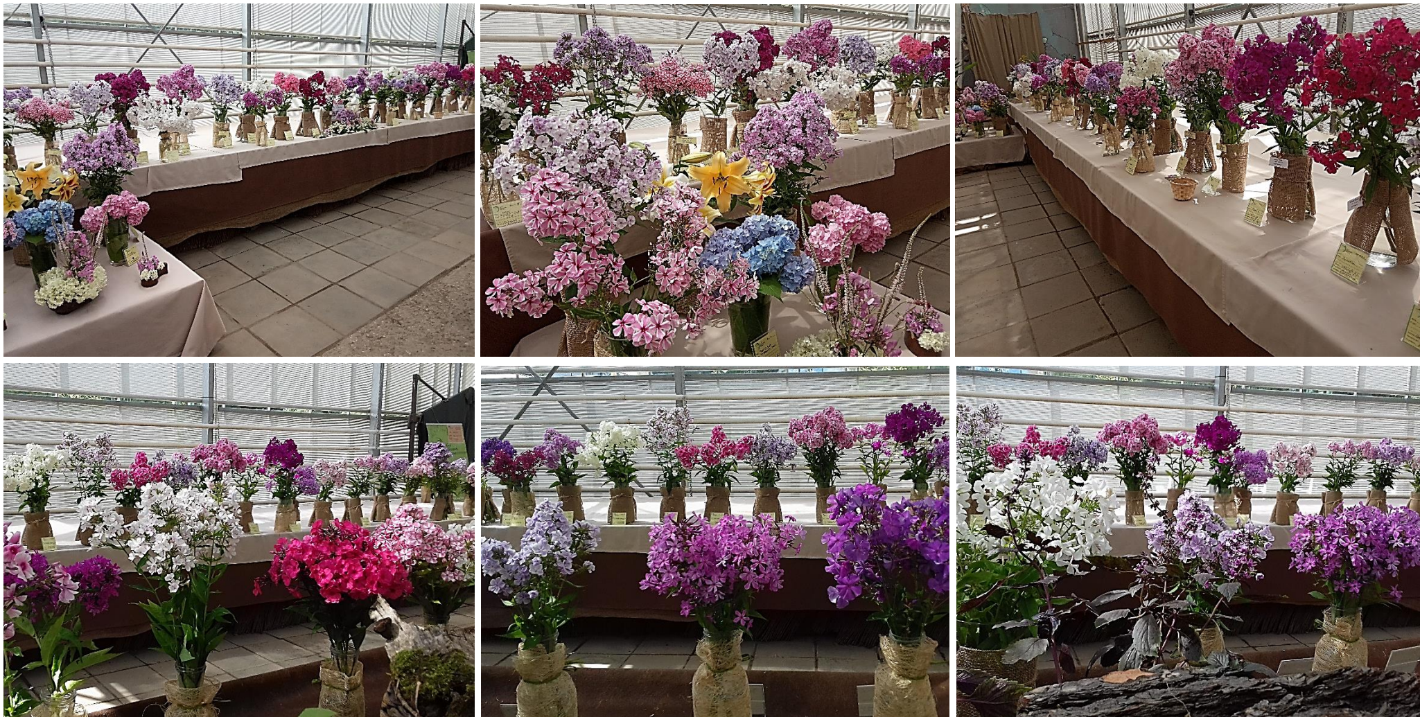
Фрагменты экспозиции в оранжерее Сада