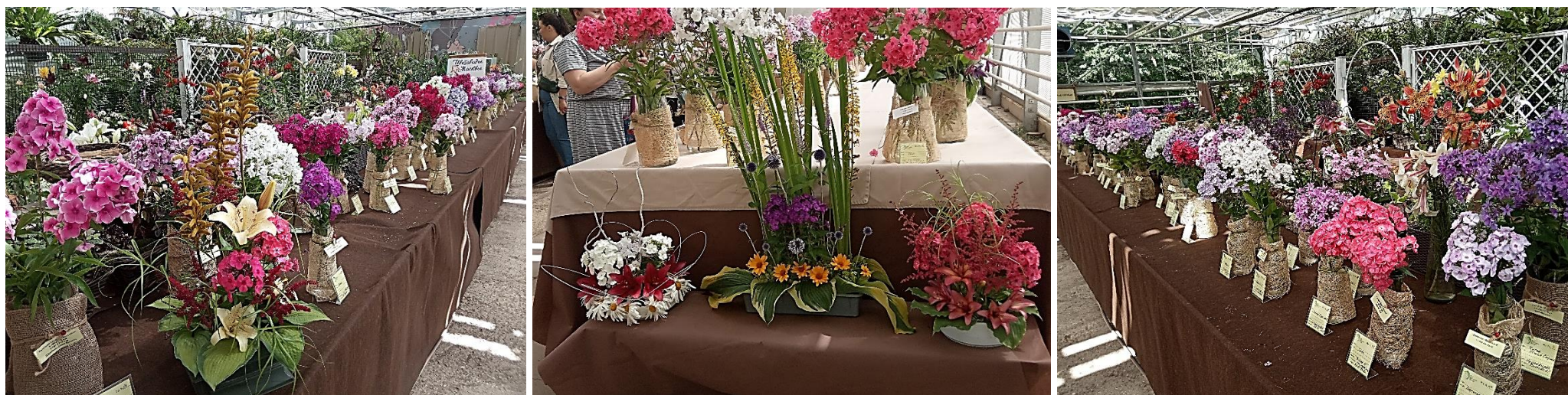
Фрагменты экспозиции в оранжерее Сада