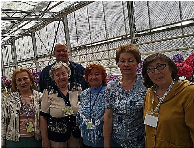
Участники выставки. Фотосессия после оформления экспозиции выставки 22.07.2023