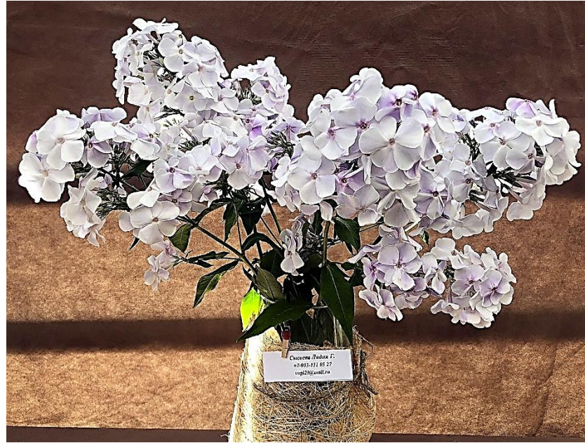
Сеянец с дымкой, под регистрационным № 52 (Музыченко*, 2022) – экспонент Музыченко Л.Н.

*выращен из семян, полученных от Ю.А. Репрёва