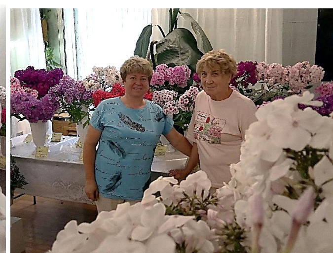
Члены Секции – участники выставки. Фотосессия после оформления экспозиции выставки 27.07.2022