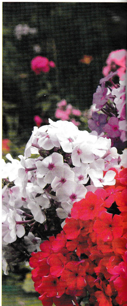
Фрагмент выставочного букета