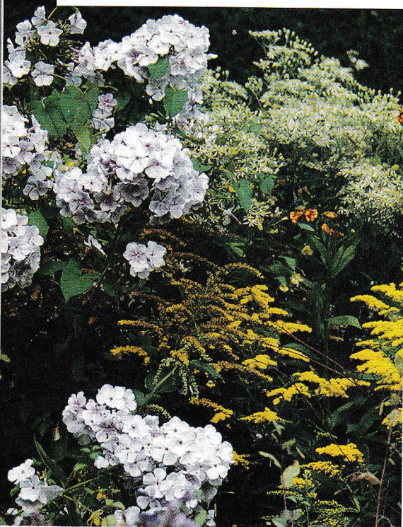
Флоксы успешно сосуществуют даже с таким агрессивным партнером, как золотарник.

На четвертый-пятый год кусты лучше разделить и посадить в новую землю. Я, честно говоря, эту операцию не люблю и омолаживаю свои флоксы черенкованием. Когда новые кустики из черенков подрастают, старые, пятишестилетние кусты просто удаляю. ■