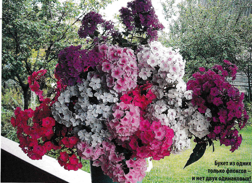
Букет из одних только флоксов – и нет двух одинаковых!