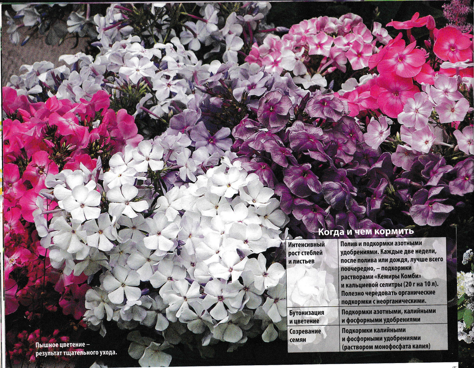
Пышное цветение – результат тщательного ухода.