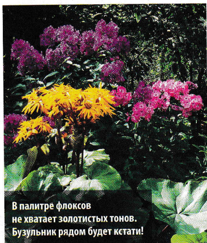
В палитре флоксов не хватает золотистых тонов. Бузульник рядом будет кстати!

Б ыла очень удивлена, когда, увидев на моих фотографиях цветки дымчатых флоксов, один биолог сказал: «Спасибо, а то я думал, что мои флоксы заболели неизвестной мне болезнью».