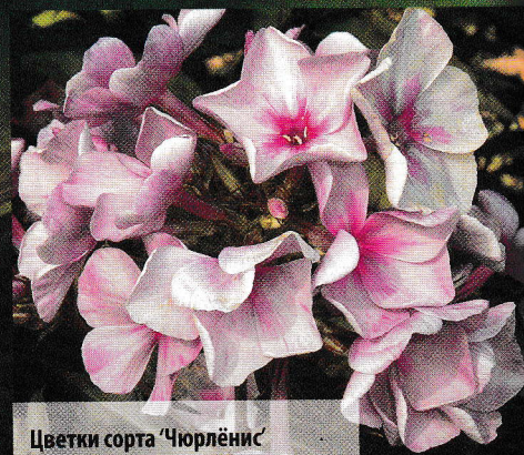
Цветки сорта ‘Чюрлёнис’ (Ю.А. Репрев) отличаются пастельной окраской.

Все прекрасно представляют себе флоксы – белые, розовые, малиновые, красные, лилово-голубые и даже фиолетовые... А какого цвета дымчатые флоксы?