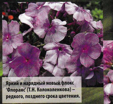
Яркий и нарядный новый флокс ‘Флоранс’ (Т.Н. Колоколенкова) – редкого, позднего срока цветения.