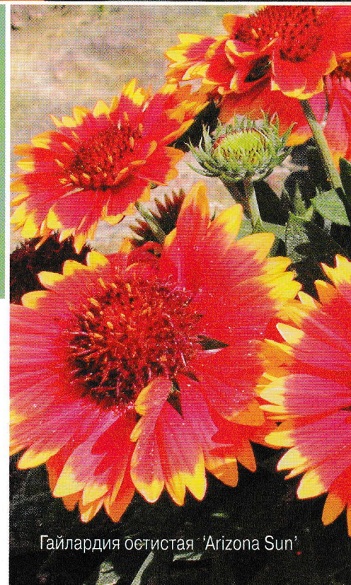
Гайлардия остистая 'Arizona Sun'

Гайлардию 'Arizona Sun' можно выращивать и как типичный многолетник при посеве в июне – июле и посадке в грунт в начале сентября.