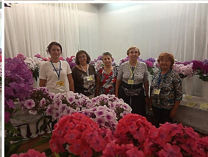
Члены Секции – участники выставки. Фотосессия после оформления экспозиции выставки 28.07.2021