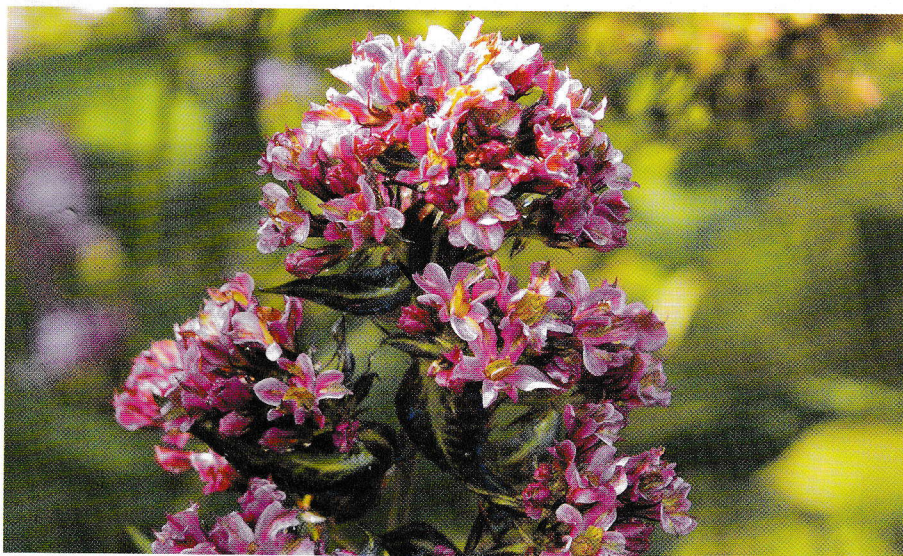
'Нэчурал Филинс' (' Natural Feelings ')