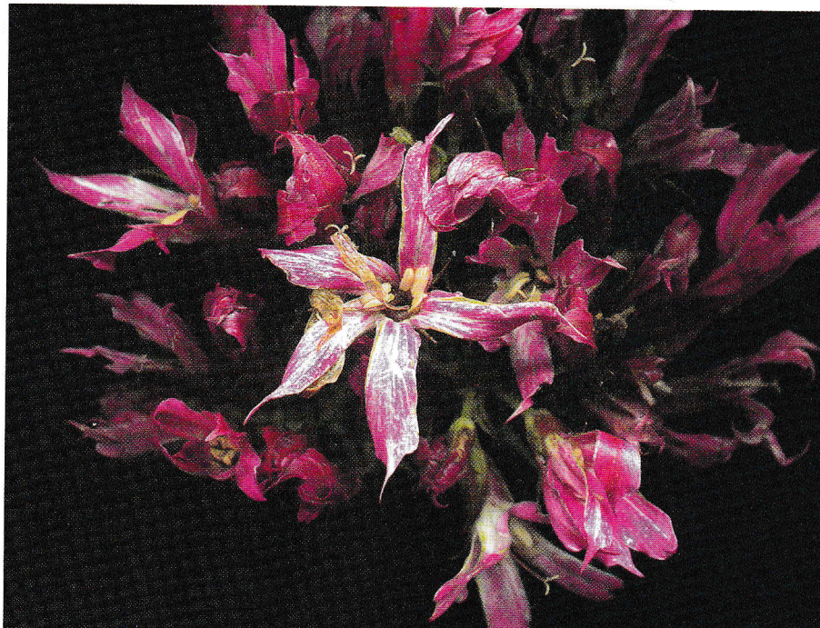
'Фэнси Филинс' (' Fancy Feelings ')

Правила ухода за сортами с пестрой листвой такие же, как и за обычными флоксами. В каталогах заявлено, что пестролистный флокс не боится мучнистой росы, и это соответствует истине, но вот пятнистости они подвержены. Зеленолистные побеги, появляющиеся иногда в куртине, следует удалять. А чтобы лучше подчеркнуть красоту листвы, сажайте пестролистный флокс отдельно от других на газоне или на однородном зеленом фоне.