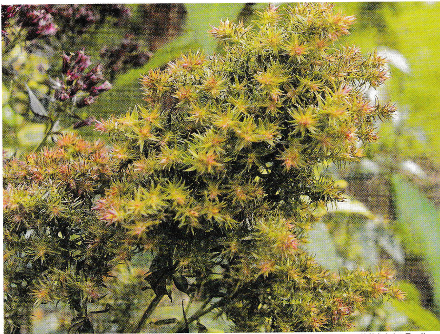
'Миднайт Филинс' – 'Midnight Feelings'

Л юбите ли вы флоксы, как люблю их я? Если да, то поймете, как приобретаю очередную новинку, с нетерпением и некоторым опасением ждешь начало цветения. Часто надежды сбываются, иногда приходит и разочарование, но с каждым годом крепнет убеждение, что флоксы удивительные цветы. И когда кажется, что уже все знаешь о любимом растении и поразить нечем, селекционеры предлагают такие новинки, что просто диву даешься.