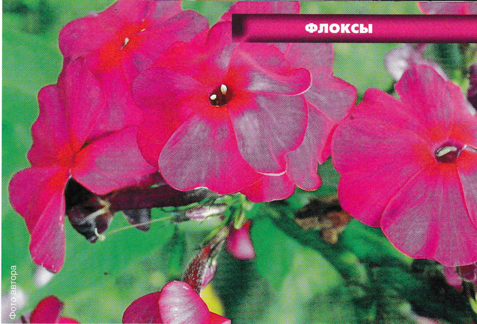
‘Аида’ ( ‘Aida’ )

‘Вильгельм Кессельринг’ – ‘Wilhelm Kesselring’ (Руис Б., 1923) Цветок диаметром 3,5 см, темно-пурпурно-фиолетовый с ярким белым центром, не выгорает. Соцветие полушаровидное, среднего размера, рыхлое. Цветет в средние сроки. Куст прочный, высотой 60–65 см. Зимостойкий. Очень яркий сорт.