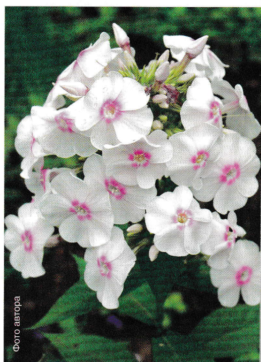
‘Европа’ ( ‘Europe’ )

‘Ле Мади’ – ‘Le Mahdi’ (Гус и Кенеманн, 1900) Цветок диаметром