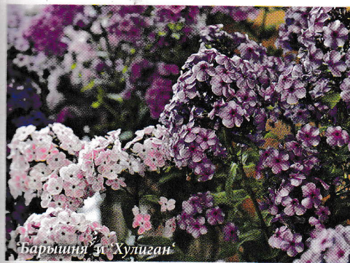
'Барышня' и 'Хулиган'