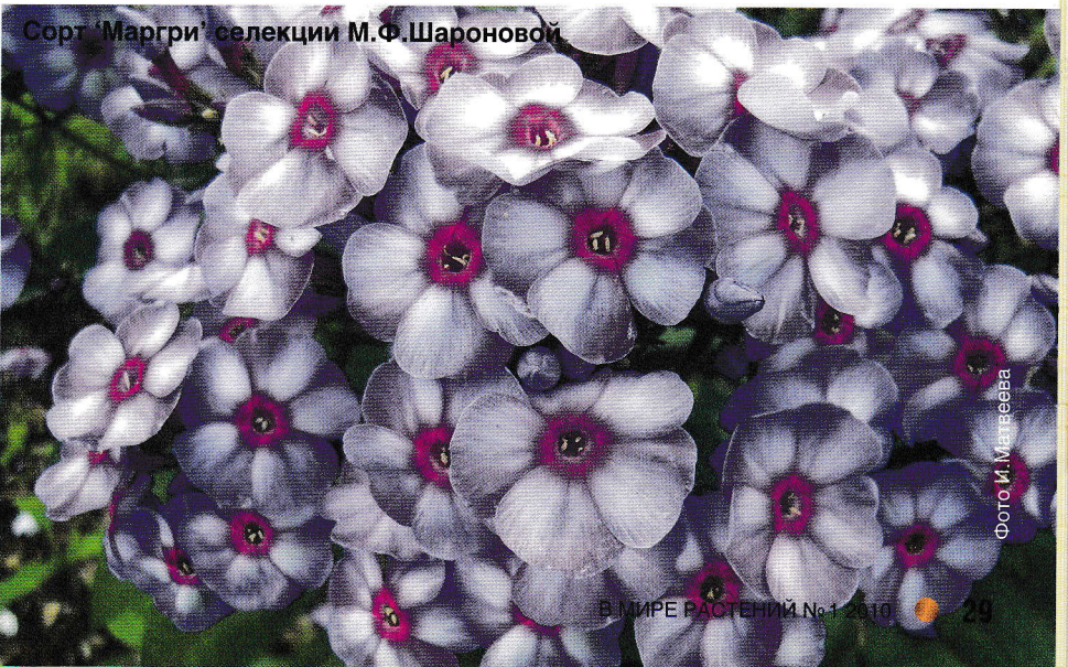
Сорт 'Маргри' селекции М.Ф.Шаронова

поврежденные части. Взял обычную газету (газета обладает антисептическими свойствами и препятствует возникновению болезнетворных бактерий), смочил ее под струей воды и завернул в нее подготовленный материал. Затем кульки положил в полиэтиленовые пакеты, дунул в них воздух и плотно завязал. Сортовые флоксы упаковал отдельно, к каждому прикрепив этикетку. В качестве этикеток использовал пластиковые коробочки от творожков и йогуртов,