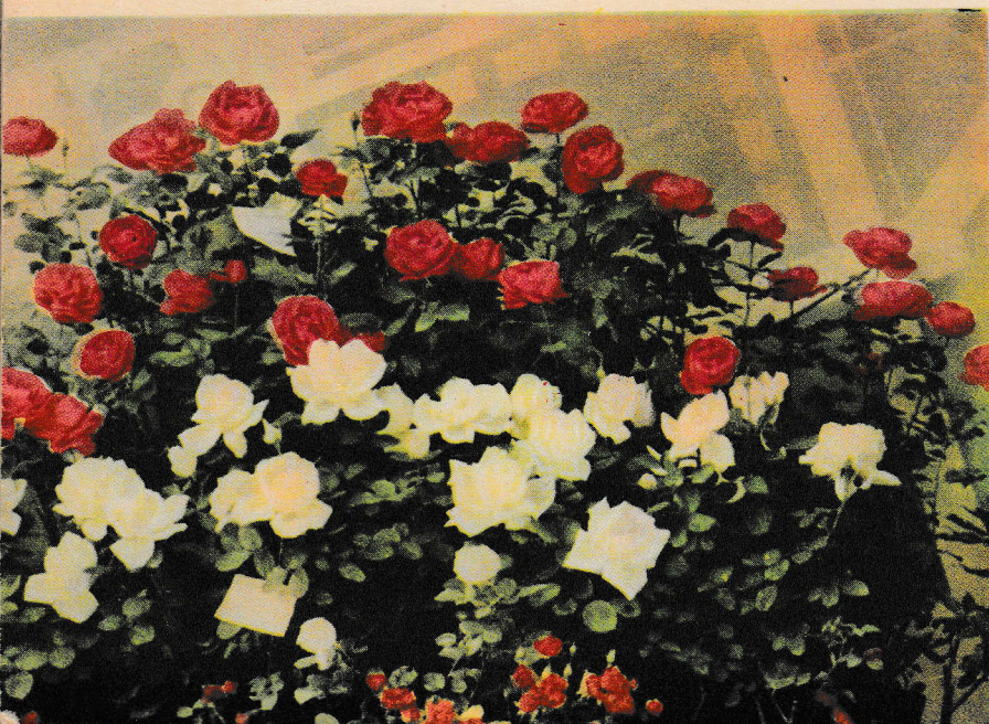
← Розы Измайловского комбината декоративного садоводства (г. Москва)